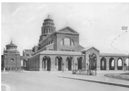
Chiesa dei Santi Nereo ed Achilleo, viale Argonne in una cartolina viaggiata nel 1941. Non si vede ancora la Casa Parrocchiale (costruita nel 1958) e sulla destra si vedono i binari e la linea aerea del tram.