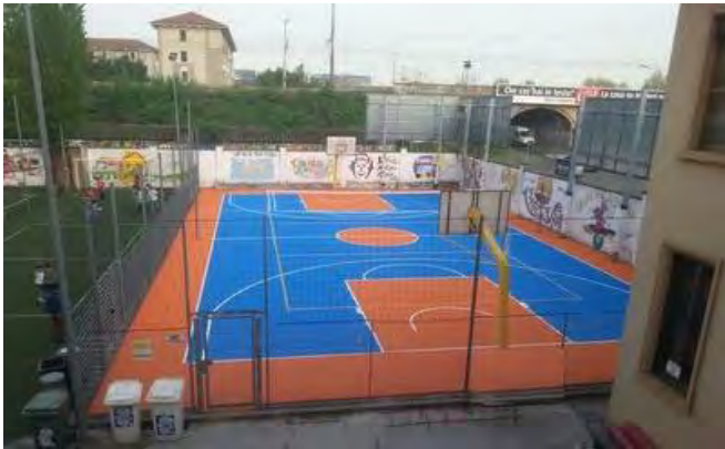
NEI GIORNI SCORSI E' STATO REALIZZATA LA NUOVA PAVIMENTAZIONE IN RESINA PLASTICA DEL CAMPO DA BASKET DEL NOSTRO ORATORIO SAN CARLO