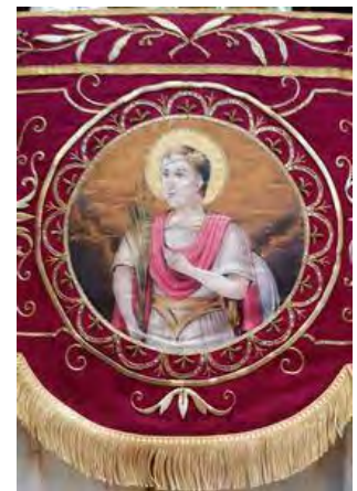
NEREO E ACHILLEO NEL FREGIO PER LE SOLENNITÀ DEI PULPITI DELLA NOSTRA BASILICA

NEI MARTEDÌ DEL MESE DI MAGGIO CI TROVIAMO PER LA RECITA DEL S. ROSARIO ALLE ORE 21: MARTEDÌ 2 CAPPELLA DI VIA SALDINI (FOTO MOSAICO) MARTEDÌ 10 NELLA CAPPELLA DELL'ORATORIO; MARTEDÌ 17 NELLA CAPPELLA DEL FAES; MARTEDÌ 24 DAVANTI