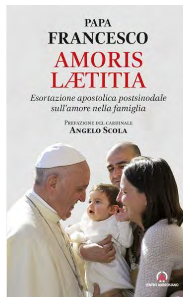
PAPA COSA PENSA OGGI LA CHIESA ATTORNO AI TEMI LEGATI ALLA VITA FAMILIARE

ALL'ICONA NEL PARCHETTO GIOCHI DELLA PARROCCHIA; L'ULTIMO INCONTRO DI PREGHIERA DEL S. ROSARIO SARÀ NELLA CAPPELLA DELLA MADONNA DI FATIMA MARTEDÌ 31 MAGGIO