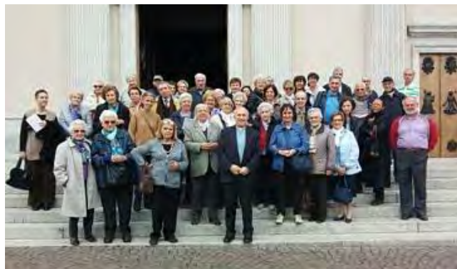
SABATO 23 APRILE – PELLEGRINAGGIO GIUBILARE DI UN CENTINAIO DI PERSONE A LECCO CON PASSAGGIO DELLA PORTA SANTA IN SAN NICOLO' E CELEBRAZIONE DELLA MESSA NEL SANTUARIO S. MARIA DELLA VITTORIA (NELLA FOTO UN GRUPPO DI PARTECIPANTI)