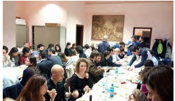
DOMENICA 17 APRILE – INCONTRO DELLE GIOVANI FAMIGLIE – DOPO LA SANTA MESSA GIOIOSO MOMENTO CONVIVIALE NELLA SALA AUGUSTONI