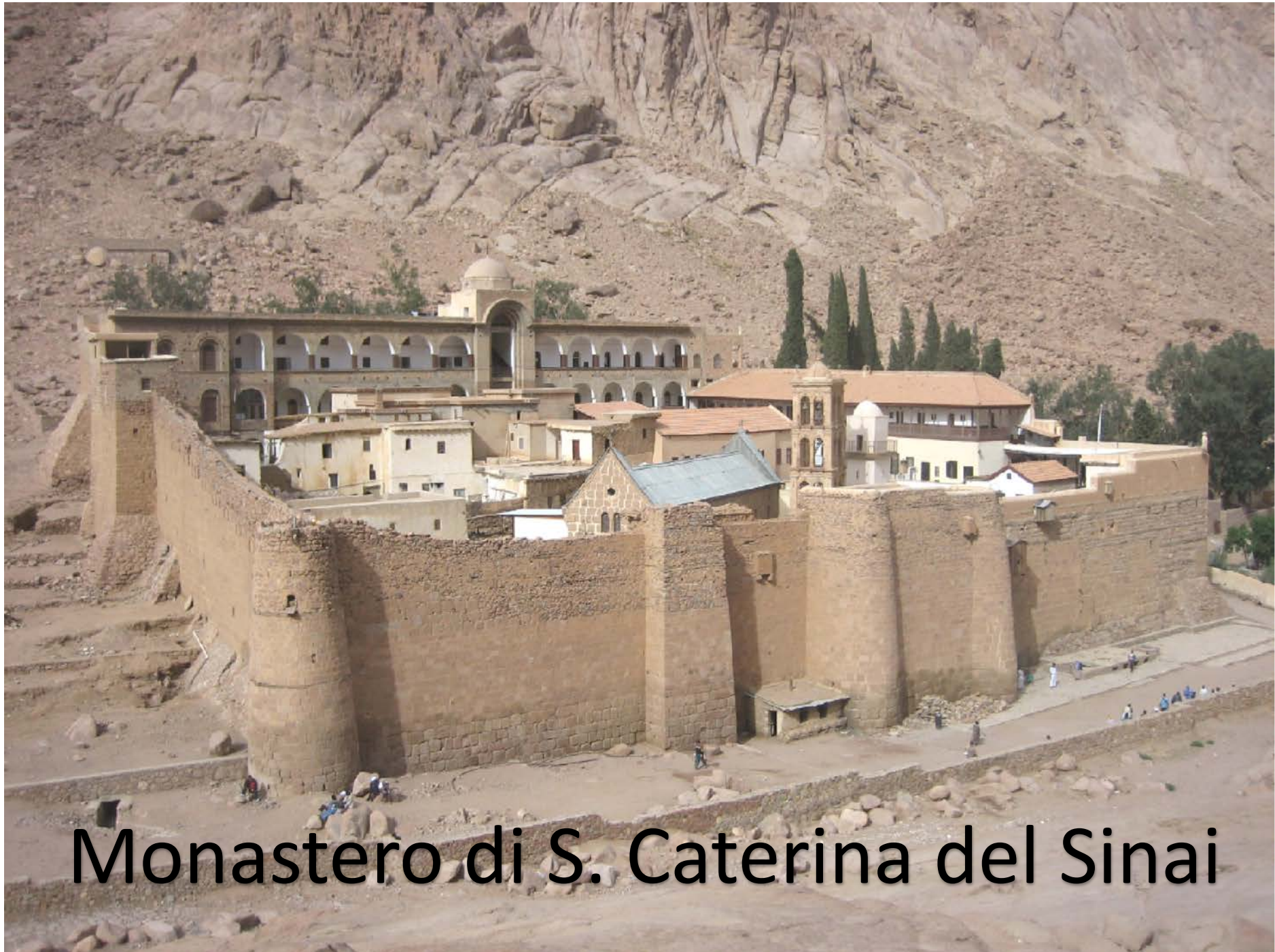
Monastero di S. Caterina del Sinai