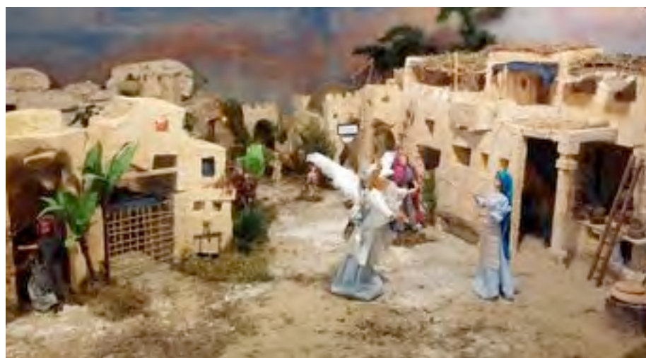
Una scena del Presepio della Basilica

I Sacerdoti della Parrocchia sono lieti di porgere a tutti i fedeli e alle loro famiglie i più cordiali auguri di BUON NATALE e di FELICE ANNO NUOVO