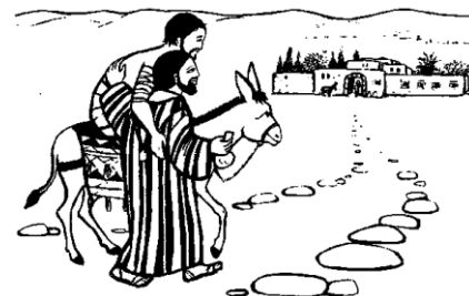
Il buon Samaritano

Abbiamo avuto diversi incontri con i membri della S. Vincenzo, che ci sono stati di grande aiuto sia per le informazioni, sia per il concreto sostegno nello svolgimento di alcune pratiche.