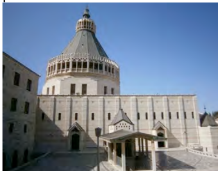
Nella foto la Basilica dell'Annunciazione a Nazaret.

In mattinata siamo partiti in pullman dalla Parrocchia per la Malpensa. Dopo il disbrigo delle formalità doganali siamo partiti con volo di linea israeliano El-Al per l'aeroporto di Tel Aviv. Arriviamo dopo 3 ore e mezza di volo in Israele, proseguimento col pullman per Nazaret dove arriviamo in serata.