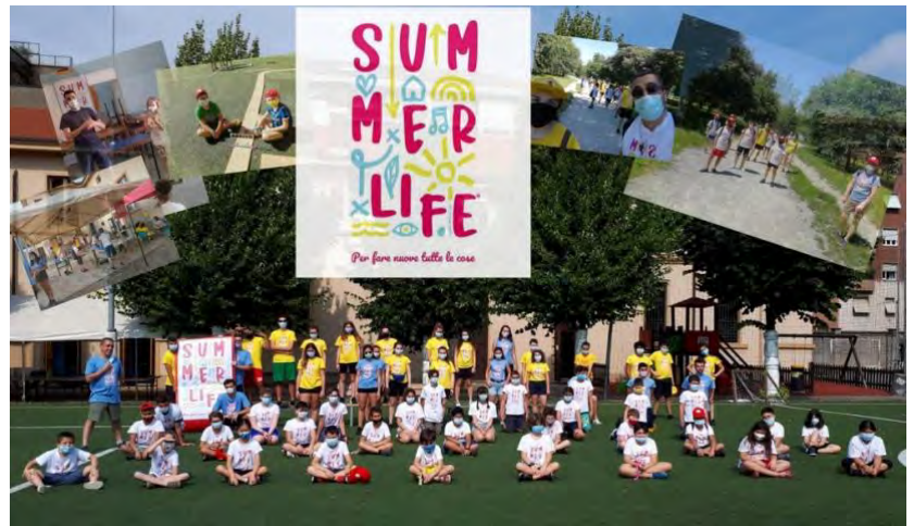
SummerLife – Centro Estivo Oratorio 2020