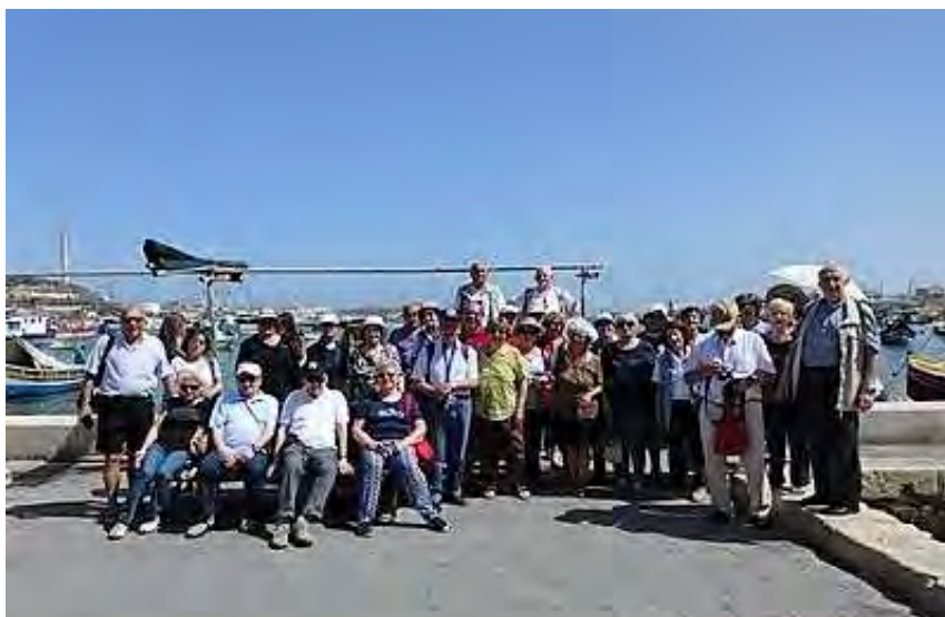
Ecco il gruppo che ha preso parte al pellegrinaggio All'isola di Malta, dove San Paolo fece naufragio