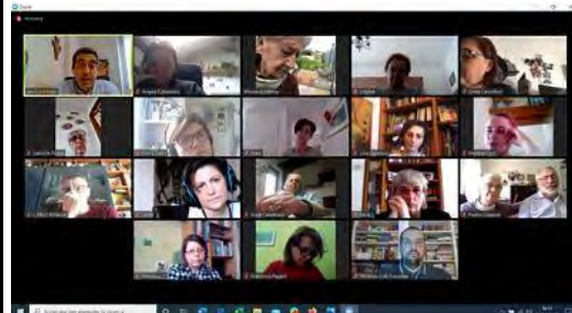
Incontri con le Catechiste