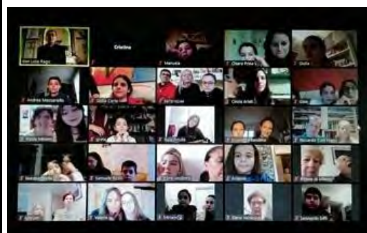
Incontri con i ragazzi