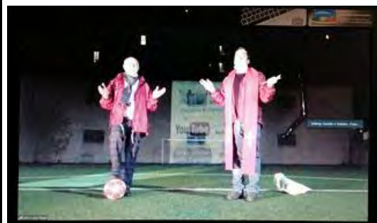
Incontri dal Campo di Calcio - CSI