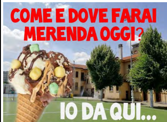
Incontri ricreativi e di preghiera su YouTube tutte le domeniche pomeriggio