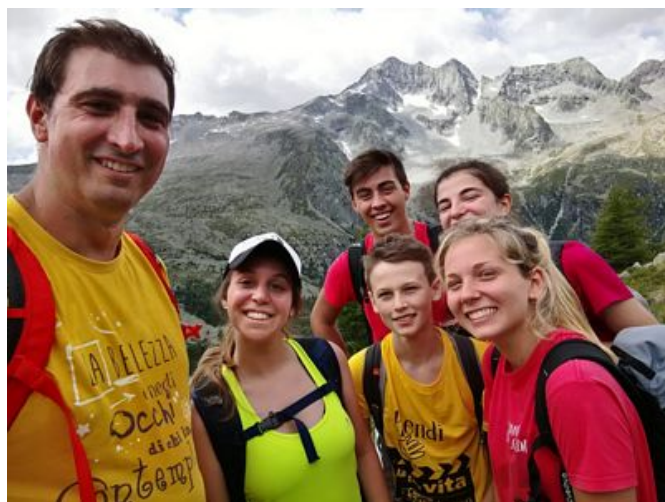
2018: VEZZA D'OGLIO