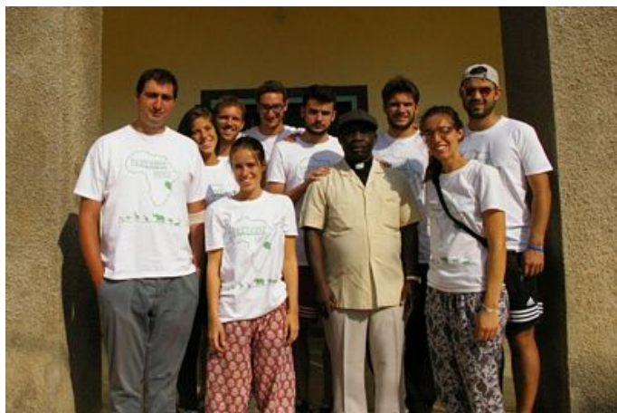
2017 ESPERIENZA DI MISSIONE IN AFRICA A PAWANGA (TANZANIA)