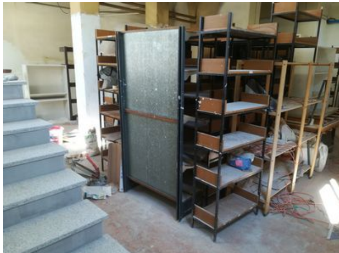
Fervono i lavori per preparare il nuovo Emporio della San Vincenzo: muratori, serramentisti, imbianchini, idraulici, elettricisti ...

Domenica 29 Settembre 2019 si terrà in Parrocchia la grande festa per l' inaugurazione , per la quale la San Vincenzo ha previsto un intenso programma che mette al centro le persone che accompagna durante l'anno: alle 11:30 sarà celebrata la Santa Messa nella Chiesa Parrocchiale e, a seguire, il pranzo con le persone e famiglie seguite e con la comunità, con animazione dedicata ai bambini; alle 15:00 il tanto atteso taglio del nastro alla presenza del Parroco don Gianluigi Panzeri e della Presidente del Consiglio Centrale di Società di