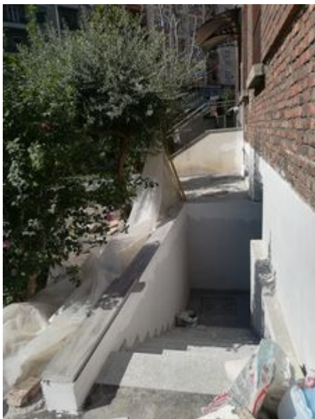
Il nuovo ingresso in fase di ultimazione all' "Emporio Federico Ozanam" Per gli assistiti della San Vincenzo

Il 29 Settembre 2019 nella nostra Parrocchia la Conferenza SS. Nereo e Achilleo di Società di San Vincenzo de Paoli ACC Milano ONLUS inaugura, nei locali totalmente ristrutturati al seminterrato con ingresso da Via Pannonia 1, l' Emporio di Federico , il nuovo guardaroba solidale. L' emporio solidale nasce per organizzare in modo rinnovato la distribuzione gratuita di abiti a persone adulte in condizioni di bisogno, un servizio pensato perché chi vi ha accesso possa essere messo nella condizione di poter indossare abiti da lui scelti e provati. I capi di abbigliamento sono suddivisi per taglia e stagione per rispondere adeguatamente, come in un vero e proprio negozio, ad una sempre crescente richiesta. L'Emporio, inoltre, mette a disposizione anche piccoli elettrodomestici, casalinghi, utensili e biancheria per la casa.