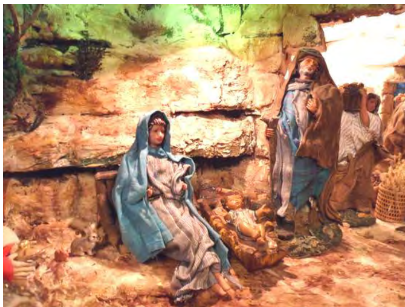
Il Presepio della Basilica

I Sacerdoti della Parrocchia sono lieti di porgere a tutti i fedeli e alle loro famiglie i più cordiali auguri di BUON NATALE e di FELICE ANNO NUOVO