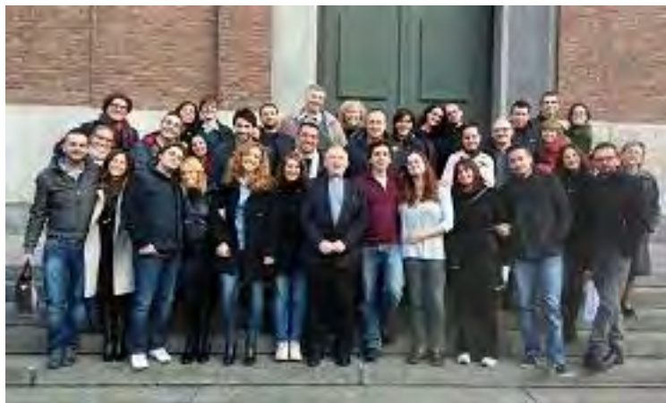
18 NOVEMBRE – MARTEDÌ: SI È CONCLUSO IL CORSO AUTUNNALE DI PREPARAZIONE AL MATRIMONIO CRISTIANO