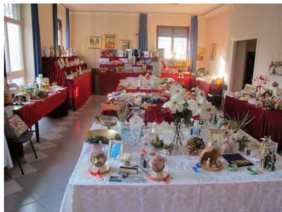
22-24 NOVEMBRE – NELLA SALA PARROCCHIALE SI È TENUTO IL TRADIZIONALE MERCATINO DI NATALE DELLA S. VINCENZO