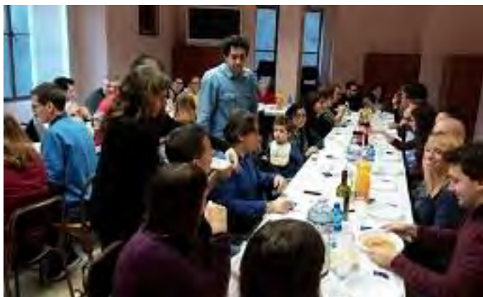
16 NOVEMBRE – DOMENICA – NELLE SALE DELL'EX ORATORIO FEMMINILE INCONTRO CONVIVIALE DEI FIDANZATI CON LE GIOVANI FAMIGLIE DELLA PARROCCHIA