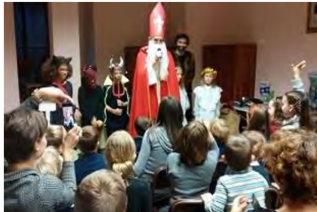
30 NOVEMBRE – DOMENICA – NELLA SALA MONS. AUGUSTONI FESTA DI SAN NICOLA CHE PORTA I DONI AI BAMBINI BUONI