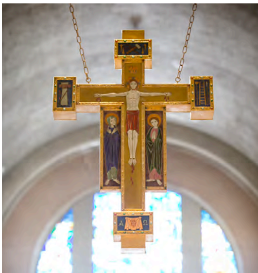
Crocefisso appeso sopra l'altare della Basilica