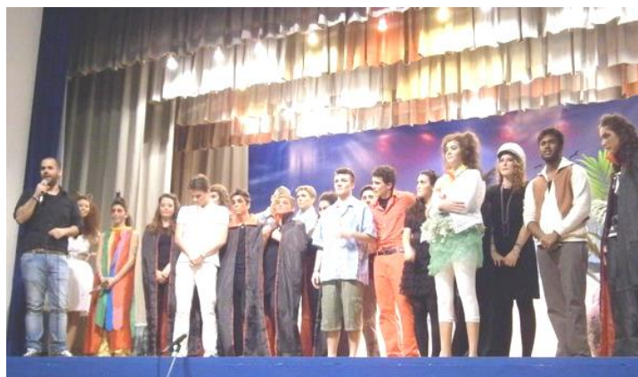
SABATO 23 MARZO ALLE ORE 21 CON REPLICA DOMENICA POMERIGGIO I NOSTRI ADOLESCENTI HANNO MESSO IN SCENA SUL PALCO DELL'ORATORIO LO SPETTACOLO NEDE: NON BRAVI, BRAVISSIMI !!!