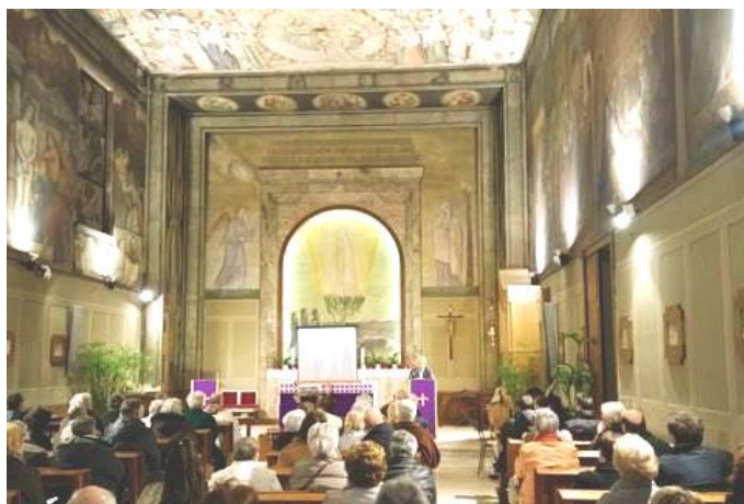
DURANTE LE SERE DELLA PRIMA SETTIMANA DI QUARESIMA NELLA CAPPELLA DELLA MADONNA DI FATIMA SONO STATI TENUTI GLI ESERCIZI SPIRITUALI DELLA PARROCCHIA