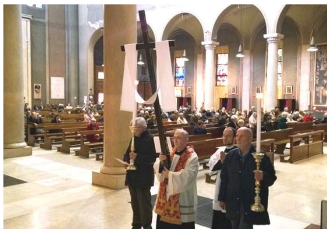
NEI VENERDÌ' DI QUARESIMA ALLE ORE 17 IN BASILICA SI CELEBRA LA VIA CRUCIS