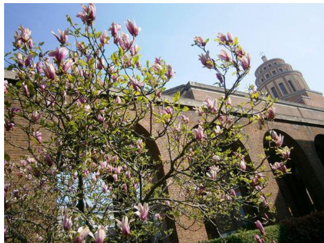
ANCHE A MILANO E' ARRIVATA LA PRIMAVERA