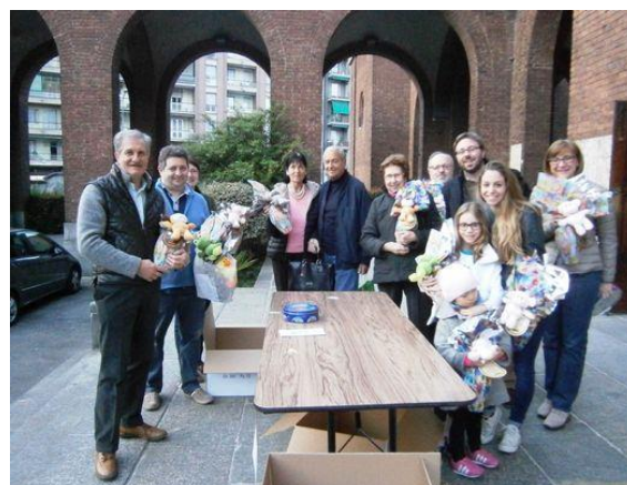
COME OGNI ANNO LA QUARTA DOMENICA DI QUARESIMA L'OFTAL (OPERA FEDERATIVA TRASPORTO AMMALATI A LOURDES) VENDE LE UOVA DI PASQUA A SOSTEGNO DEI PELLEGRINAGGI A LOURDES DI PERSONE NON ABBIENTI O DI BAMBINI AMMALATI