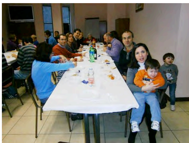
24 NOVEMBRE – DOMENICA – NELLA SALA MONS. AUGUSTONI SI INCONTRANO LE GIOVANI FAMIGLIE DELLA PARROCCHIA