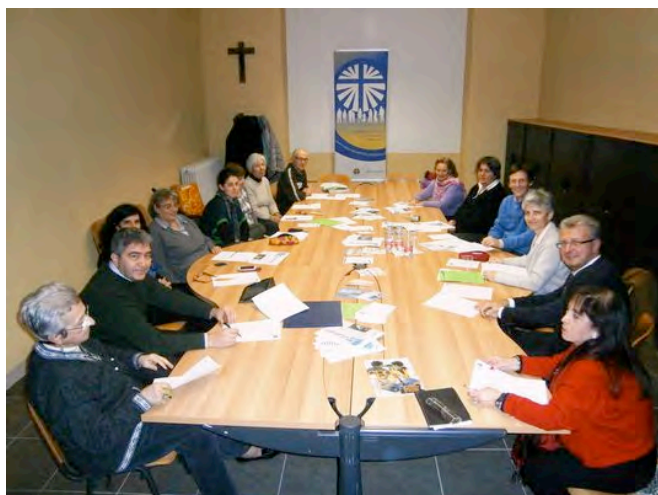
23 NOVEMBRE – NELLA NUOVA SALA DEI CONSIGLI SI È TENUTA L'ASSEMBLEA ELETTIVA DELL'AZIONE CATTOLICA