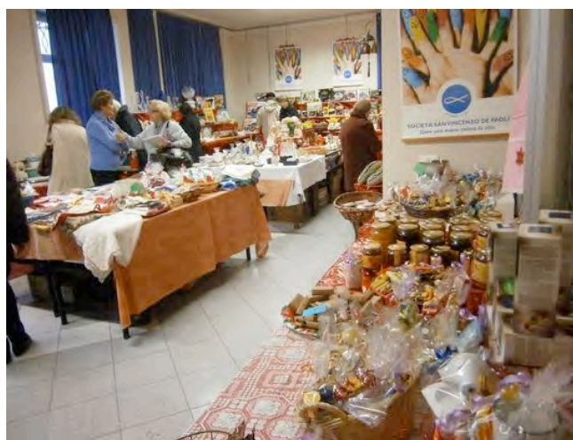
23-25 NOVEMBRE – NELLA SALA PARROCCHIALE SI È TENUTO IL TRADIZIONALE MERCATINO DI NATALE DELLA S. VINCENZO