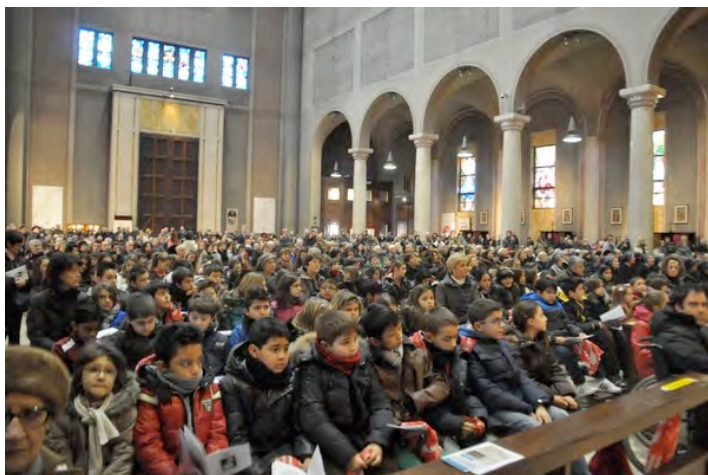
LA BASILICA ERA GREMITA DI FEDELI ATTENTI E PARTECIPANTI