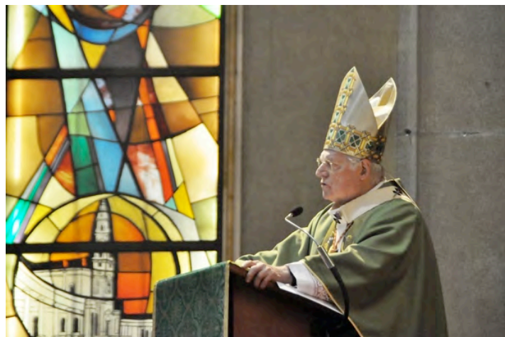
LA BELLA E RICCA OMELIA DI SUA EMINENZA SI PUÒ RIASCOLTARE E VEDERE SUL SITO DELLA PARROCCHIA - www.nereoachilleo.it