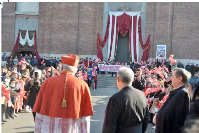
DOMENICA 11 FEBBRAIO - IL CARD. ANGELO SCOLA GIUNGE ALLA NOSTRA PARROCCHIA PER LA SANTA MESSA DELLE ORE 10.30