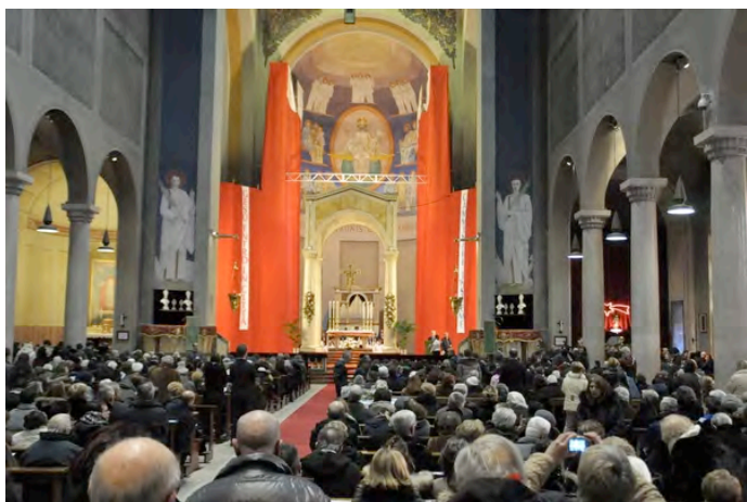
LA BASILICA PARATA A FESTA, CON DUE SCRITTE: GESÙ ENTRÒ IN CITTÀ E CAMMINARE INSIEME