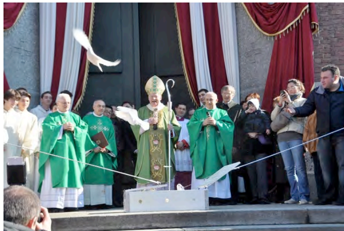
AL TERMINE DELLA MESSA IL VOLO DI QUARANTA COLOMBE

Anche sul sito della diocesi si trova la documentazione della visita nella nostra Parrocchia: http://www.incrocinews.it/chiesa-diocesi/scola-la-misericordia-del-signore-br-%C3%A8-grande-1.70499