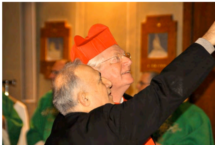
IL NOSTRO PARROCO MOSTRA ALL'ARCIVESCOVO I LAVORI REALIZZATI DALLA DITTA MARCATO PER IL RESTAURO CONSERVATIVO DELLA CUPOLA E DEL TIBURIO DELLA BASILICA