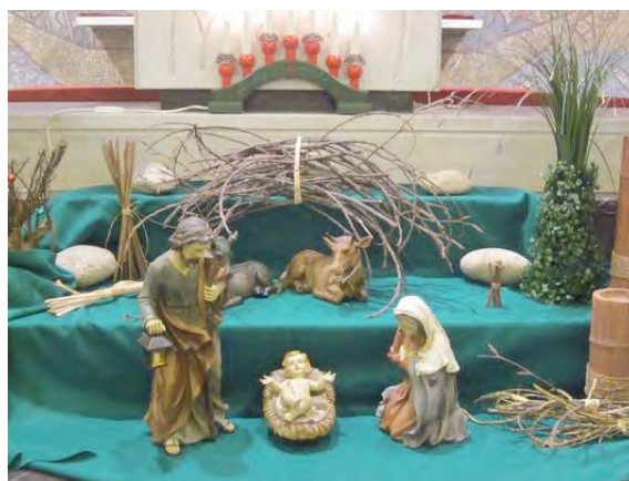
ARTE POVERA NEL PRESEPE AI PIEDI DELL'ALTARE NELLA CAPPELLA DI DIO PADRE IN VIA SALDINI