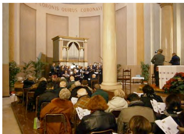
21 DICEMBRE, ORE 21 - NATALE CONCERTO DI NATALE DELLA CAPPELLA MUSICALE E STRUMENTISTI DELLA BASILICA: NOTE NELLA NOTTE SANTA