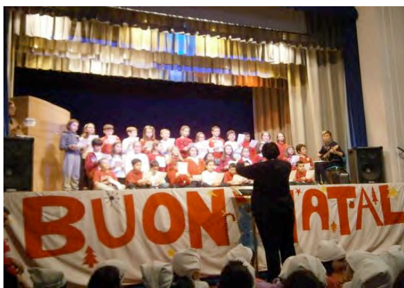
19 DICEMBRE, ORE 20.30 – SI SONO ALTERNATI SUL PALCO DELL'ORATORIO TUTTI I GRUPPI DELLA CATECHESI PER DIRE SOPRATTUTTO COL CANTO LA GIOIA DEL NATALE