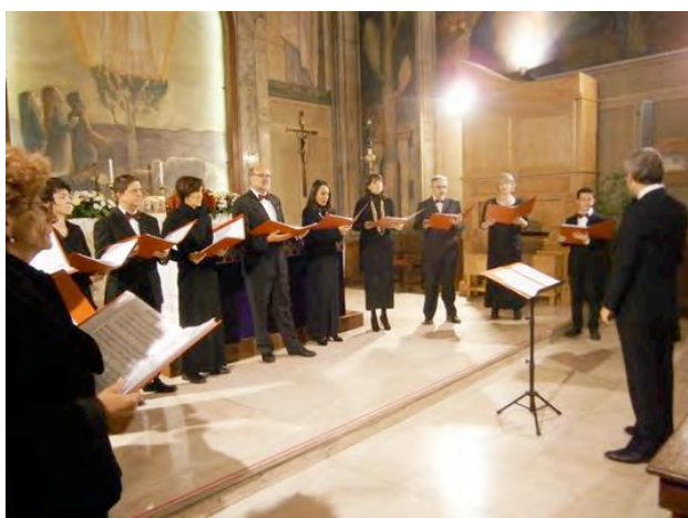
14 DICEMBRE, ORE 21 – NELLA CAPPELLA DELLA MADONNA DI FATIMA CONCERTO DI NATALE DEL GRUPPO CHANSON D'AUBE