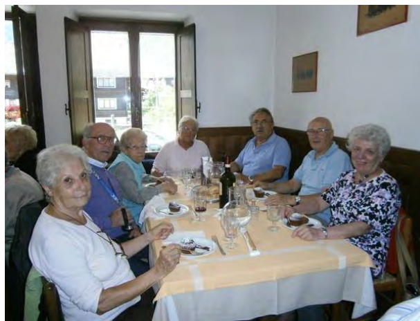
AL RISTORANTE DELL'HOTEL CASA ALPINA DE FILIPPI MENU: POLENTA E CERVO