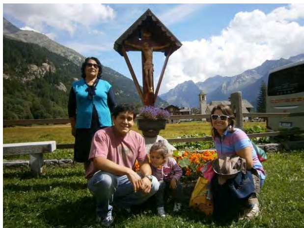
UNA BELLA FAMIGLIA IN GITA