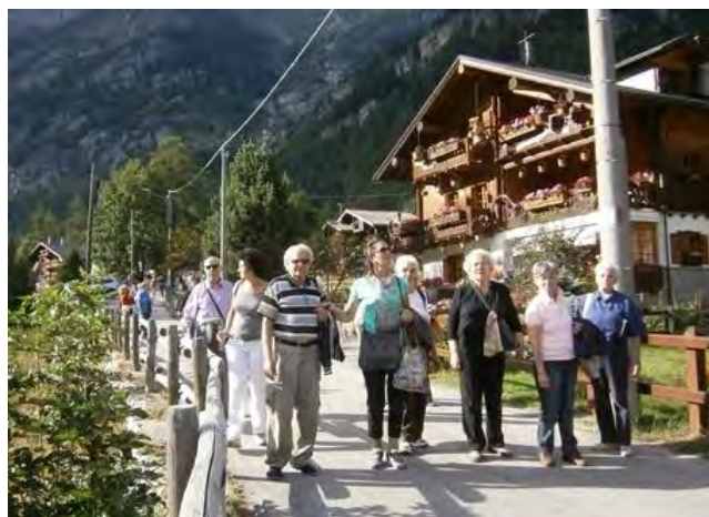
QUATTRO PASSI TRA LE CARATTERISTICHE CASE WALSER DI MACUGNAGA