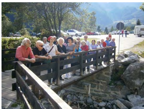
SUL PONTICELLO DI PECETTO DI MACUGNAGA