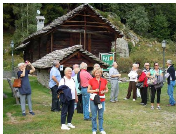
ECCOCI AL "DORF" DI Z'MACANA'