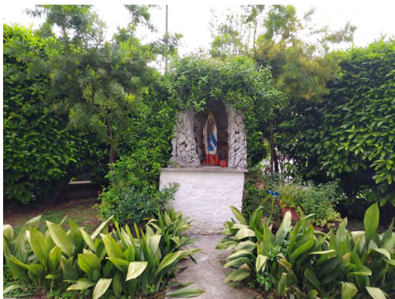
Maggio dedicato alla Madonna: la grotta nel giardino della Parrocchia